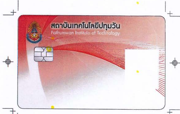
Front/KTB IPAC ATM Card Pathumwan Institute of Technology /CM *K